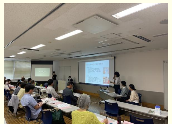
令和6年度プレゼンテーションの様子