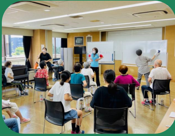
調布市難聴者体操の会