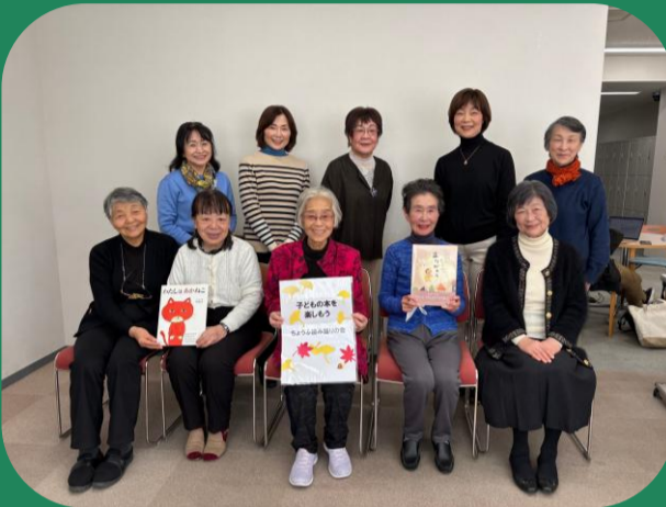
調布読み語りの会