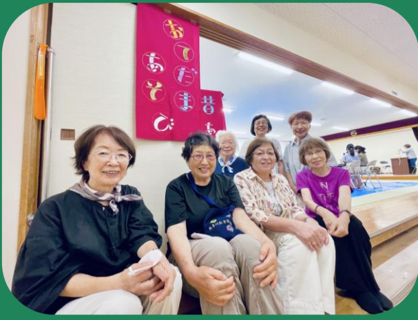
たま川お手玉の会