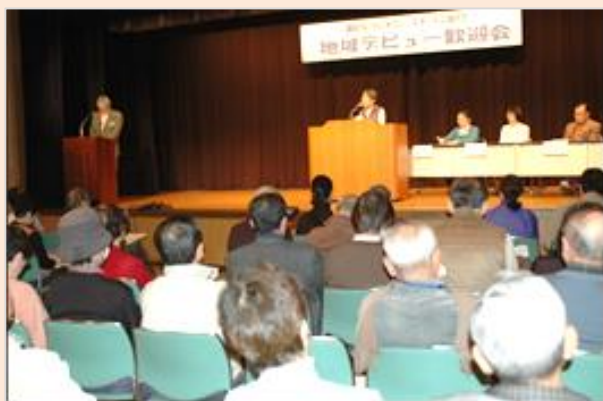
■第1回地域デビュー歓迎会の様子（平成19年2月）

推進委員の皆様が、工夫を凝らし続けてこられた地域デビュー歓迎会には是非参加いただき、楽しく、そして有意義な時間をお過ごしください。