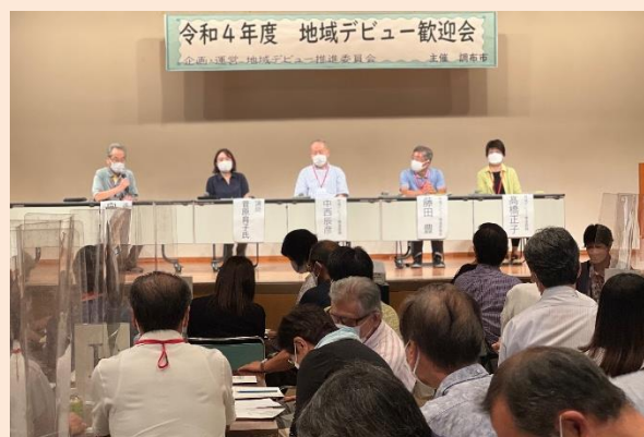
■第16回地域デビュー歓迎会の様子（令和4年9月）