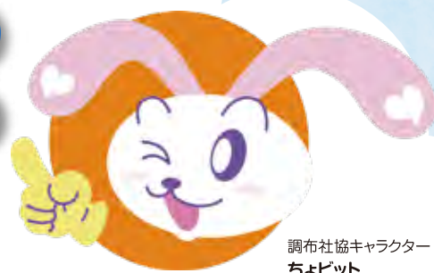
調布社協キャラクター ちょビット