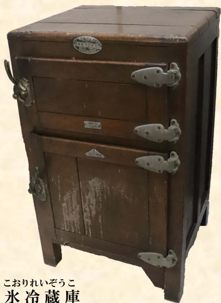
こおりれいぞうこ 氷冷蔵庫