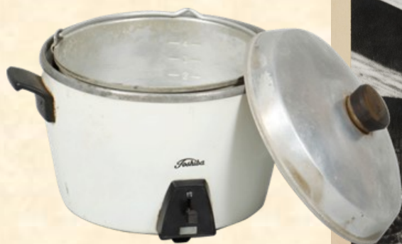
じどうしきでんきがま 自動式電気釜