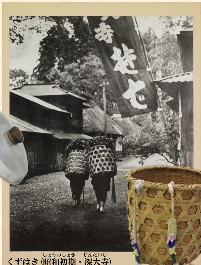
しょうわしよき じんだいじ くずはき (昭和初期・深大寺)