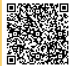
郷土博物館 ホームページ