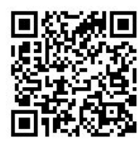
郷土博物館 ツイッター