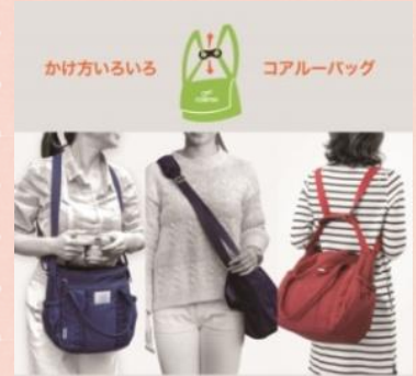
かけ方いろいろ コアルーバッグ